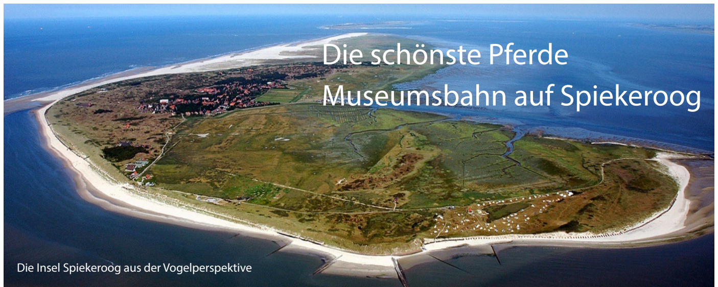
Die Insel Spiekeroog aus der Vogelperspektive

Die Insel Spiekeroog befindet sich im niedersächsischen Wattenmeer - zwischen den Inseln Langeoog und Wangerooge und ist 8,25 km 2 groß. Die geringste Entfernung zum Festland beträgt 5,7 km - die Insel ist autofrei und über eine Fährverbindung mit dem Neuharlingersiel verbunden. Die Herkunft des Namens Spiekeroog, urkundlich erstmals im Jahr 1398 als „Spickeroch“ erwähnt, ist umstritten.