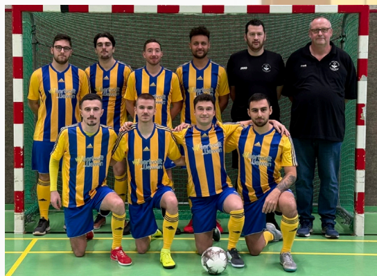
FC Ateliers Lëtzebuerg