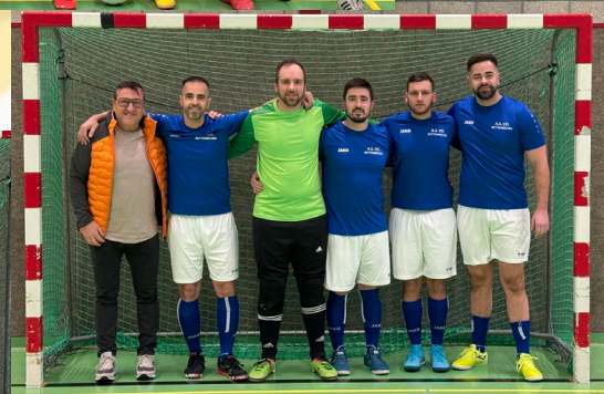
AS CFL Bettembourg