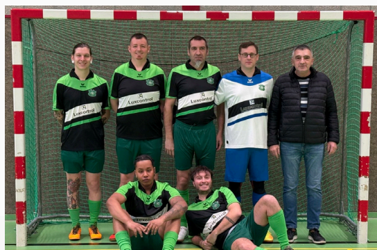
FC CFL Zwickau 77