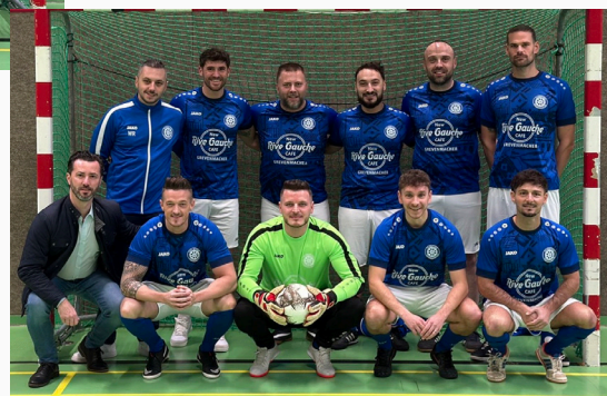
FC Fahrpersonal 58