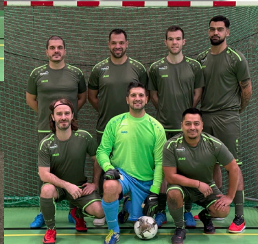
FC CFL Rodange 78