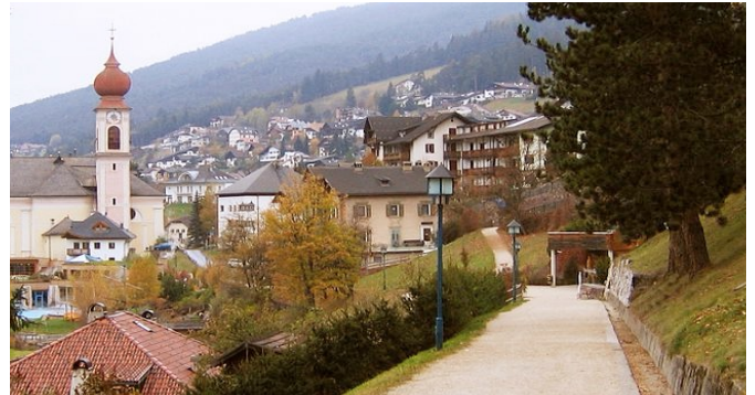
Der Wanderweg „Luis Trenker“ auf der früheren Bahnstrecke bei Sankt Ulrich