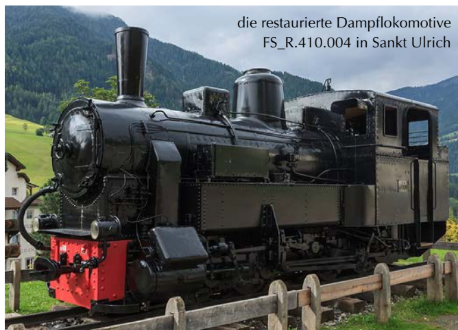
die restaurierte Dampflokomotive FS_R.410.004 in Sankt Ulrich

In den 1950er Jahren litt die Bahn unter ihrem schlechten Allgemeinzustand, da die italienische Eisenbahngesellschaft FS nicht genügend investierte und die geplante Modernisierung unterblieb. Der schlechte Zustand des Rollmaterials und der