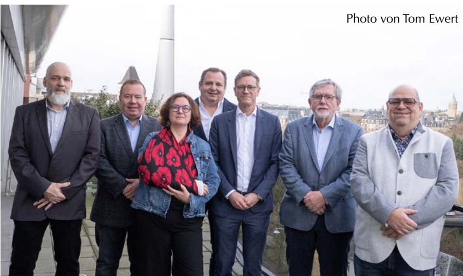
Neujahrsgratulationen der SYPROLUX-Verantwortlichen an die CFL